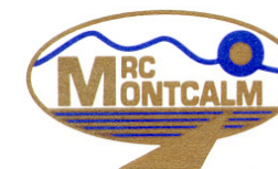
SCHÉMA D'AMÉNAGEMENT RÉVISÉ