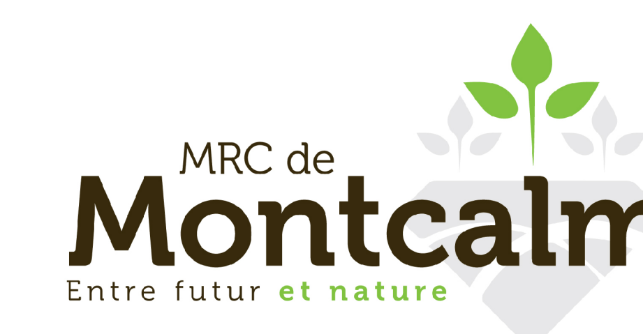
Schéma d'aménagement et de développement révisé